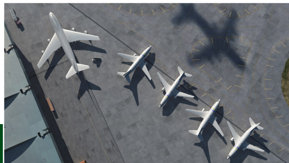
L'Etude d'Elaboration des Programmes de Développement des Infrastructures Aéronautiques des Aéroports de Tanger, Marrakech et Agadir