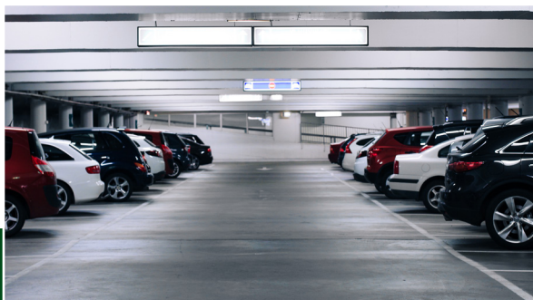
L'Assistance à Maîtrise d'Ouvrage pour la mise en place des Parkings en Ouvrage à Casablanca dans le cadre de Partenariat Public Privé (PPP).