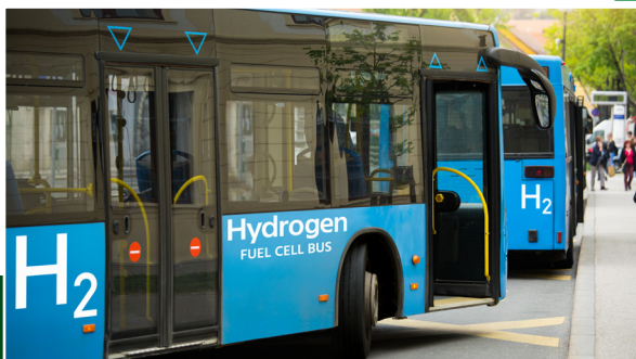
L'Etude des Perspectives de Développement de Mobilité Electrique des Bus Urbains au Maroc