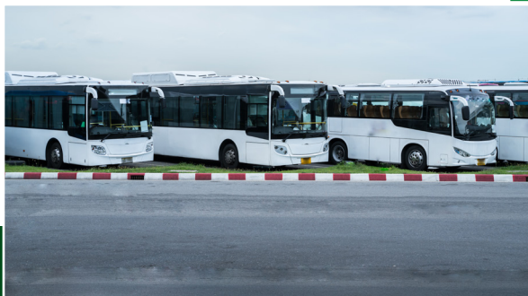
L'Elaboration du Plan de Déplacements Urbains de la Ville de Tanger