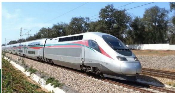
La Maîtrise d'œuvre du Projet de la Ligne à Grande Vitesse reliant Kénitra à Marrakech – Lot 2 : Ain Sbaa – Nouacer,

Voici une liste non exhaustive des principales références récentes de l'activité Transports, Mobilités & Aménagements :