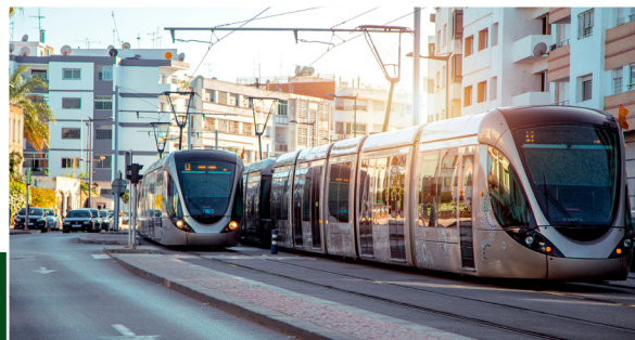
Les Etudes Préliminaires et d'Avant-projet de l'Extension des Lignes Tramway de Rabat-Salé-Témara (Phase 3),