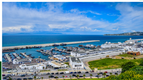
L'élaboration du Master Plan de la Zone Industriale-Logistique du Nouveau Port de Kénitra Atlantique.